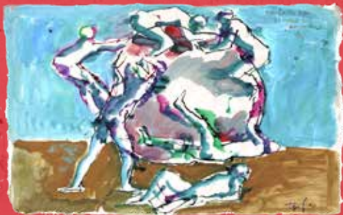
Illustrazione di Dario Fo

Quale SOCIETÀ VOGLIAMO contribuire a COSTRUIRE?